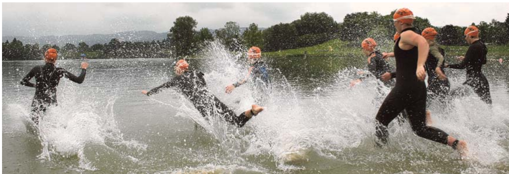
Etwas Überwindung war nötig, um bei den widrigen Wetterbedingungen in den kühlen Schlossee zu springen. Dennoch waren die Teilnehmer des Tri-Cross Salem mit Eifer dabei.